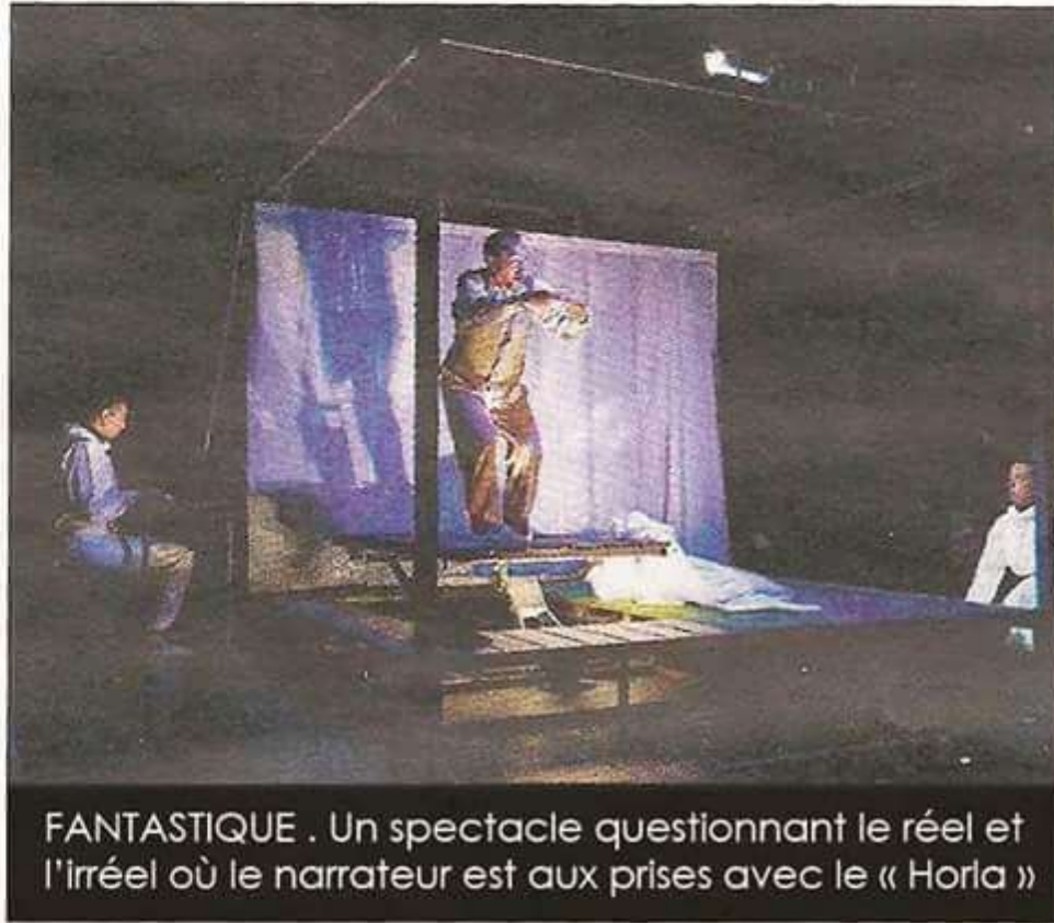
FANTASTIQUE . Un spectacle questionnant le réel et l'irréel où le narrateur est aux prises avec le « Horla »

Cette version est adaptée aux collégiens et la mise en scène permet de faire un va-et-vient entre le réel